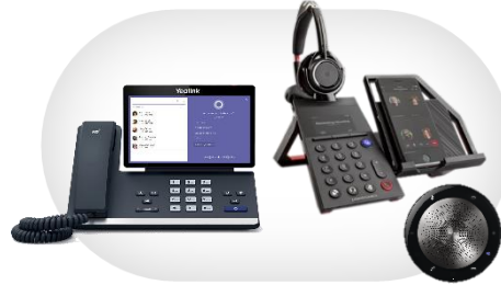
Desk Phones und Zubehör